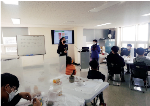
▶ 불광천 친환경 기획봉사단 - 환경교육