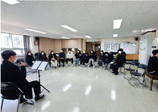
▶ 2021년 12월 대학생 봉사단 '에블루션' 송년회