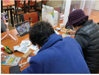
▶ 은평 디지로그인 후속모임