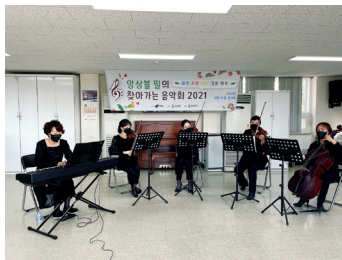
▶ 문화공연_양상블 필의 찾아가는 음악회