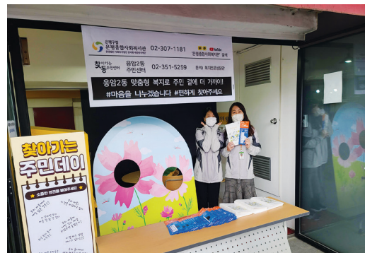
▶ 응암2동 찾아가는 주민데이