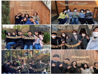
▶ 2021년 전직원연수