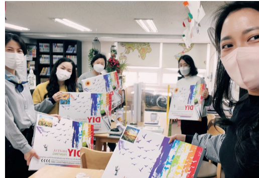
▶ 명화그리기 프로그램 활동 사진