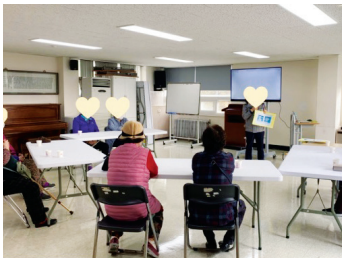
▶ 어르신 시민경찰학교