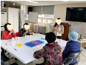
▶ 어르신 설거지비누 만들기 체험활동