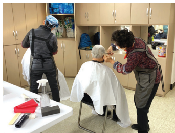
▶ 무료 이미용 서비스