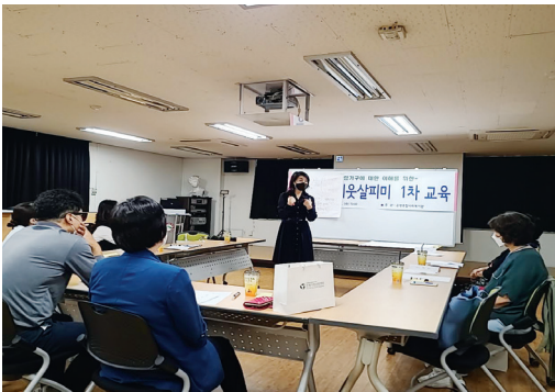
▶ 응암2동 이웃살피미 역량강화 교육