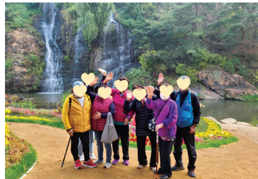
▶ 어르신 가을 나들이